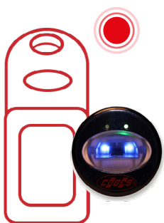
KEY KEY IR